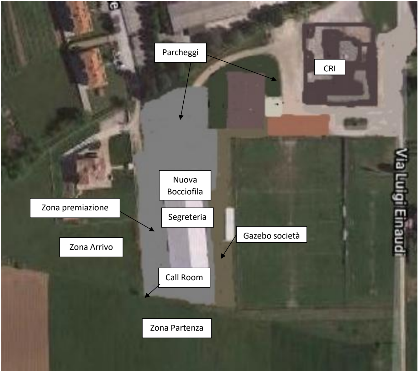
Giro 2 Km